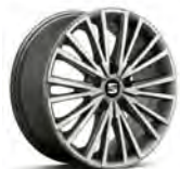
17 inch Dynamic Machined 30/4 (PUA-1)