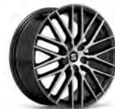
19 inch Performance Black (RL6)