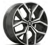
18 inch X-PERIENCE Machined (PUL)