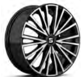
17 inch Dynamic Machined 30/4 (PUA-2)