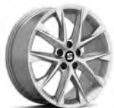
18 inch FR Performance 30/1 (PUM)