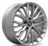
17 inch Dynamic 30/3 (PUB)