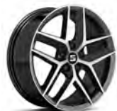
18 inch Performance Machined 30/2 (PUK)